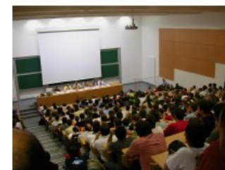
Table-ronde « Quel environnement juridique pour le Logiciel Libre ? » à Vandoeuvre-les-Nancy en 2006.

Toulouse, ville candidate pour les Rencontres Mondiales du Logiciel Libre — 8