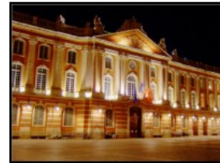
Le Capitole, symbole de Toulouse

Toulouse et la région Midi-Pyrénées sont des acteurs forts en matière de technologies de l'information et de la communication, notamment au travers du pôle de compétitivité Aéronautique, Espace et Systèmes embarqués. Les Logiciels Libres occupent une place de plus en plus importante auprès des acteurs locaux et régionaux. L'engagement politique existant envers les Logiciels Libres conforte la position de la candidature de Toulouse pour l'organisation des Rencontres Mondiales 2010.