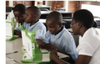
Jeunes Rwandais découvrant l'ordinateur à bas coût du projet « One laptop per child », qui fonctionne avec des logiciels libres (Kigali, sept. 2008).

Les Logiciels Libres sont conçus à l'échelle mondiale par une communauté de contributeurs bénévoles et salariés, ayant pour objectif la construction d'un bien commun accessible par tous. Le mouvement des Logiciels Libres est porteur de valeurs humanistes d'entraide, de solidarité, et promeut le partage des connaissances.