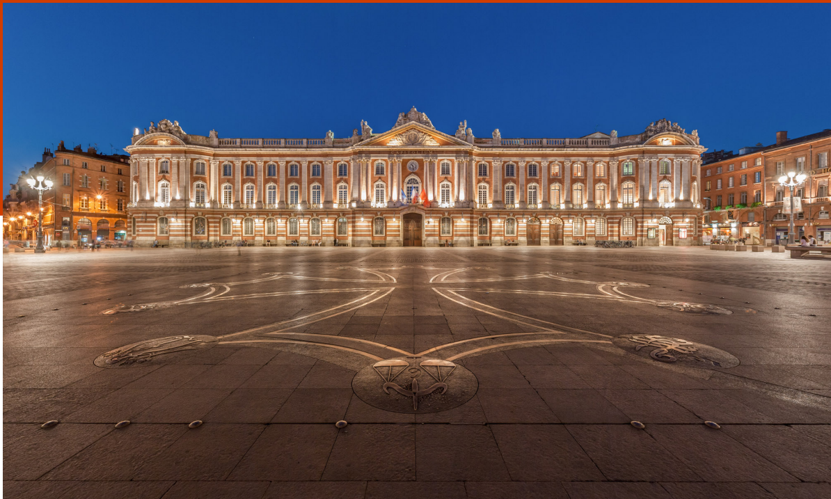
Benh LIEU SONG – CC-BY-SA 3.0