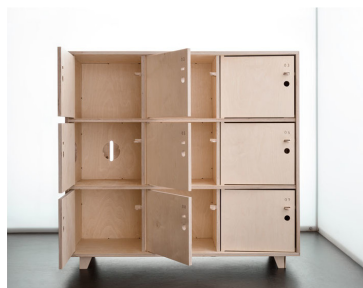
Meuble designé par Scarlett SAN MARTIN, CC-BY

La philosophie du logiciel libre s'est étendue à d'autres domaines, notamment :