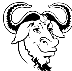
Logo du projet GNU

En 1984, Richard Matthew STALLMAN rédige la licence publique générale GNU (la « GPL ») permettant d'assurer et de protéger les libertés définies par le logiciel libre.