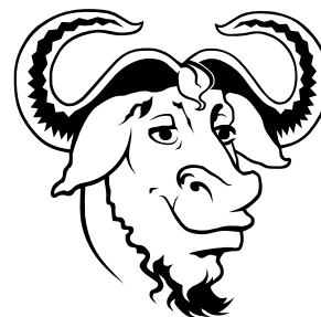
Logo du projet GNU

En 1984, Richard Matthew STALLMAN rédige la licence publique générale GNU (la « GPL ») permettant d'assurer et de protéger les libertés définies par le logiciel libre.